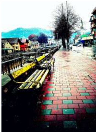
Autor: Anesa Hidić