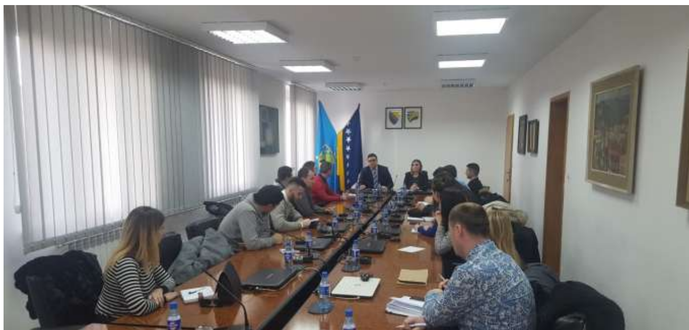
Sastanak Ministarstva sa predstavnicima omladinskih organizacija TK

Novoosnovano ministarstvo nastalo je kao rezultat razdvajanja ranijeg resora Ministarstva obrazovanja, nauke, kulture i sporta, a sve sa ciljem strateškog djelovanja u ovom polju i ozbiljnijeg bavljenja potrebama mladih, ali i razvojem ključnih oblasti za njihov napredak i razvoj.